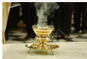
Vuur- en wierookschaal.

Wij hebben onze eerste stapjes, aarzelend, gezet op facebook. We willen dit experiment in de komende tijd uitbreiden. Bezoek onze pagina op LKD community en laat uw commentaar bij ons prille begin.